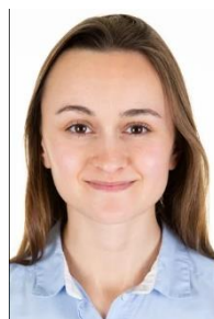
Photo qui sera sur votre carte Twisto Atoumod

Si vous souhaitez modifier votre photo, cliquez sur celle-ci et choisissez-en une nouvelle (1). Votre photo doit respecter le format passeport.